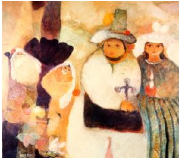
Temas del Campo Autor: Elmar René Rojas Técnica: Óleo