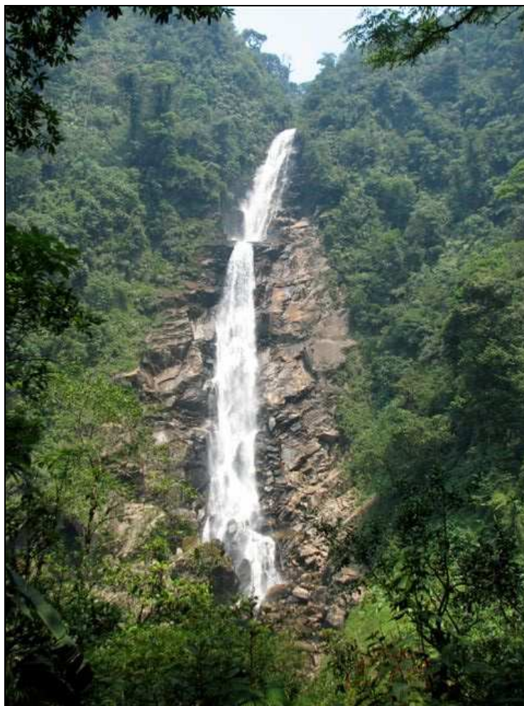
Reserva de la Biosfera Sierra de las Minas, El Salto de Chilascó. Salamá, Baja Verapaz. Consejo Nacional de Áreas Protegidas -CONAP-