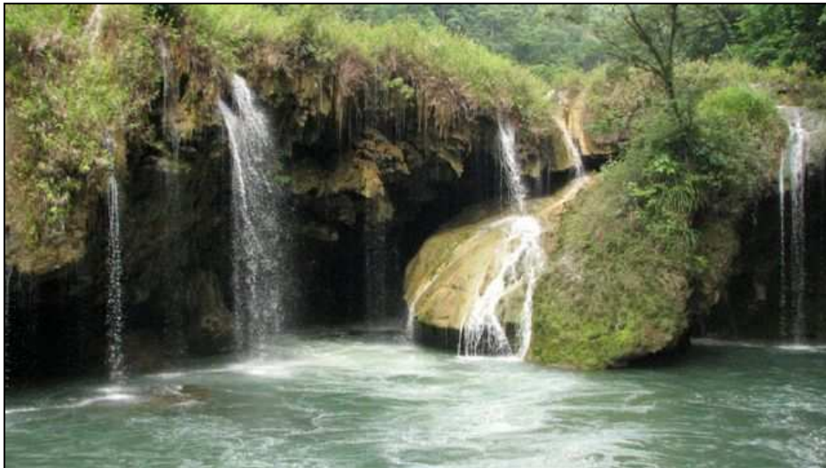
Monumento Natural Semuc Champey. Lanquín, Alta Verapaz. Consejo Nacional de Áreas Protegidas -CONAP-