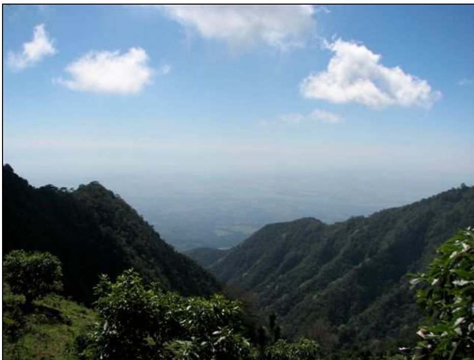
Reserva Natural Privada Santa Isabel. Pueblo Nuevo Viñas, Santa Rosa.

Consejo Nacional de Áreas Protegidas -CONAP-