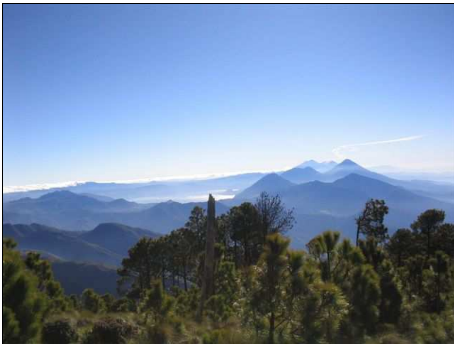
Reserva de Uso Múltiple de la Cuenca del Lago de Atitlán -RUMCLA-. Sololá. Consejo Nacional de Áreas Protegidas -CONAP-