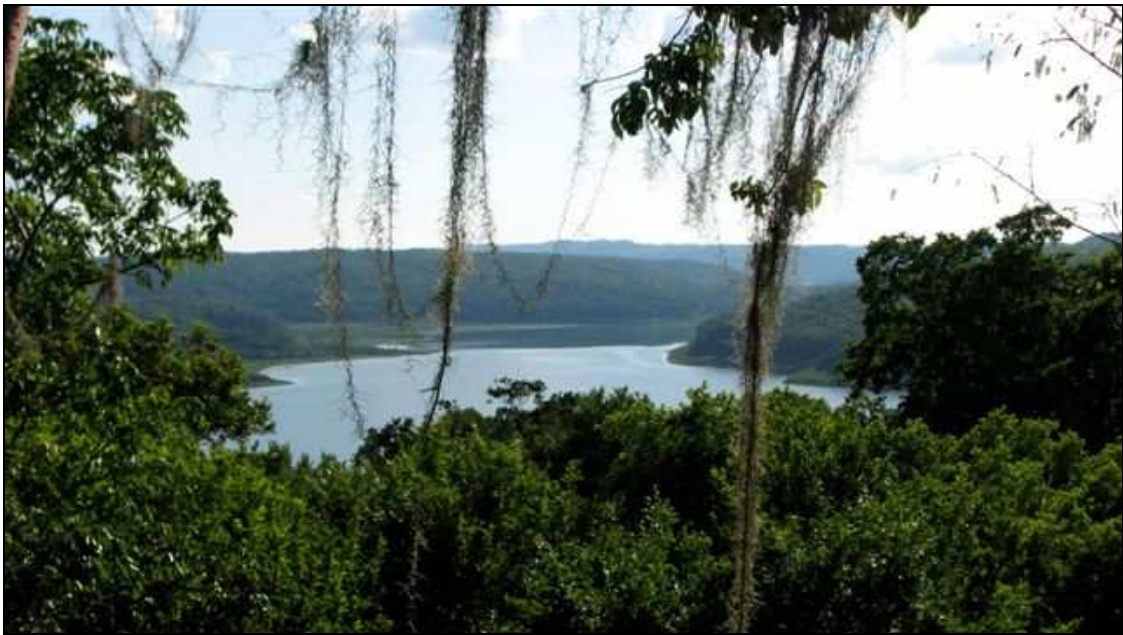
Parque Nacional Yaxhá-Nakúm-Naranjo. Reserva de la Biosfera Maya, Petén. Consejo Nacional de Áreas Protegidas -CONAP-